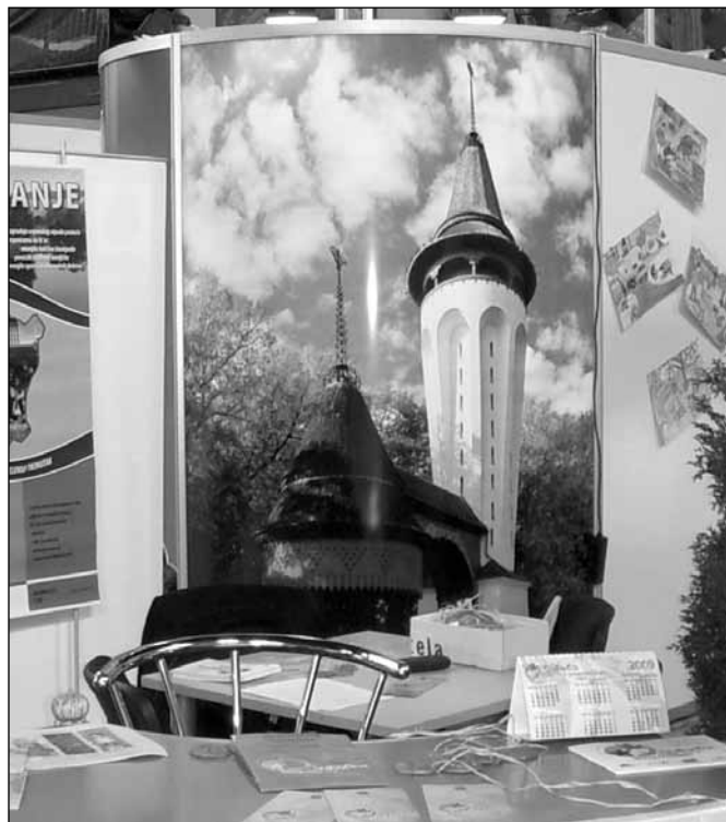
Sajamski štand Subotice 2010.